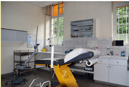
Salle de consultation de médecine

Visites des installations du service de soins somatiques, rencontres des équipes