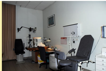
Salle de consultation d'ophtalmologie